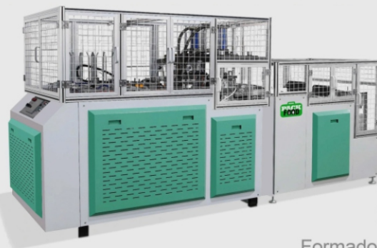
Termoformadora de Caixas ZXR

110 peças/min 100 a 800 g/m 2 100 x 330 mm